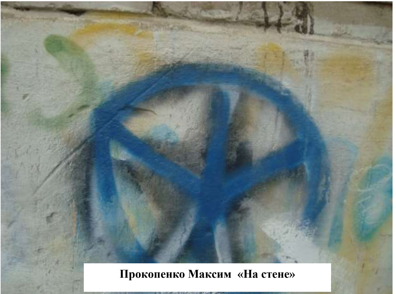
Прокопенко Максим «На стене»