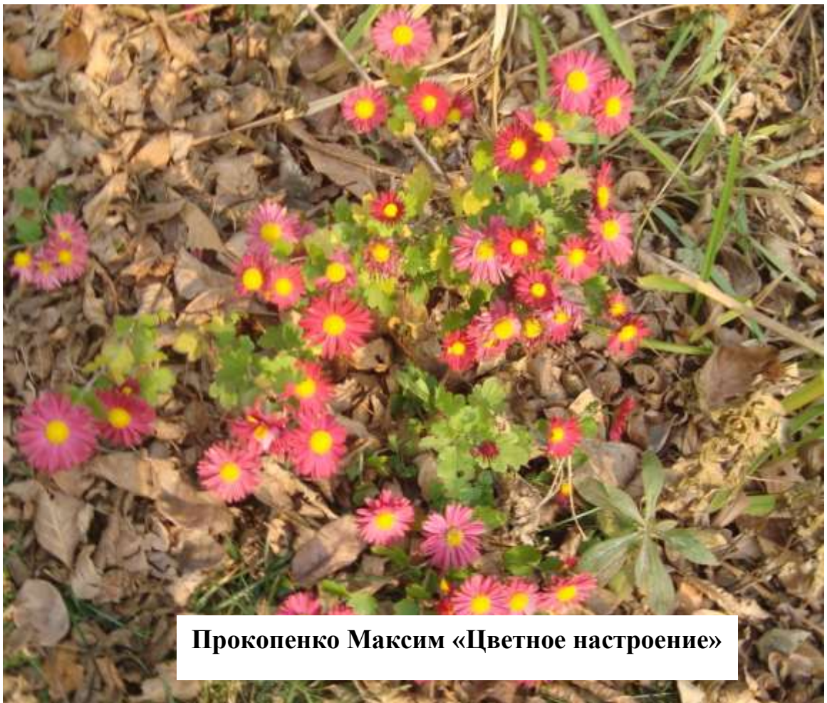
Прокопенко Максим «Цветное настроение»